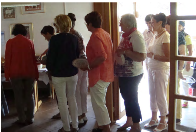
„Schlange“ stehen vor dem großen Büfett