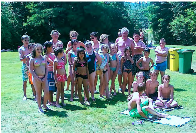
Teilnehmer des Badeausflugs

Aber am 17.09.2015, nach Ferienende, erwarten wir alle Spieler/Spielerinnen wieder beim Training. Eventuell können weitere Spieler und Spielerinnen geworben werden, dann könnte wieder eine weibliche