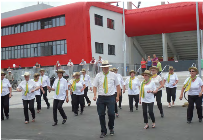
Die Line-Dance-Show sorgt für Furore