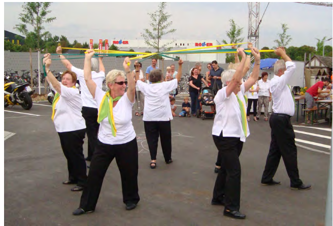
Einblick in die Ganzkörper Gymnastik mit Band