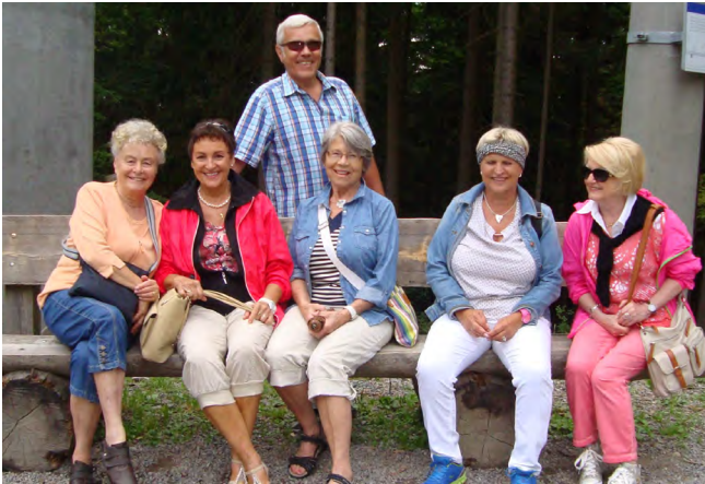
Eine kurze Verschnaufpause muss auch mal sein