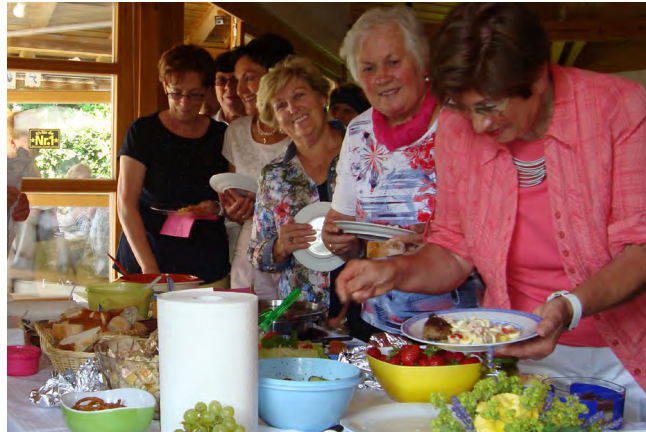
Die „Schlacht“ am kalten Büfett