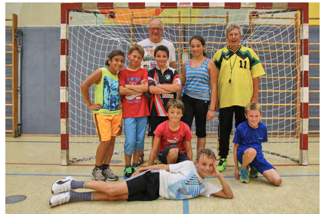
Jungen und Mädchen kurz vor den Ferien