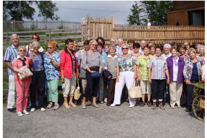
Ein schöner Tag geht dem Ende zu