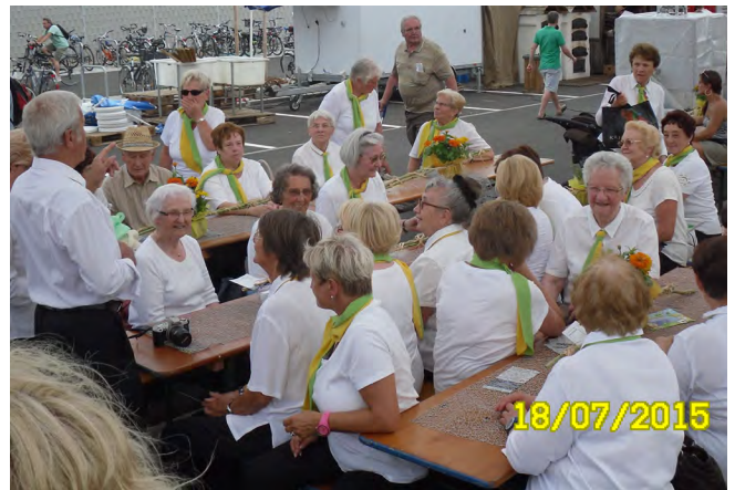
Die Senioren warten auf den großen Auftritt

aufgebaut war -verschwand über Nacht und wir mussten unseren „Bärenstarken“ Auftritt auf der schnöden Teerdecke hinlegen. Doch davon ließen wir uns nicht irritieren. Gekonnt „zog“ die Tanzgruppe ihre „Show“ ab, was den Moderator der Stadt dazu brachte, eine Zugabe für das Publikum zu verlangen mit dem Hinweis, dass diese vom TVA aufgezeichnet und in ihrem Programm ausgestrahlt wird.