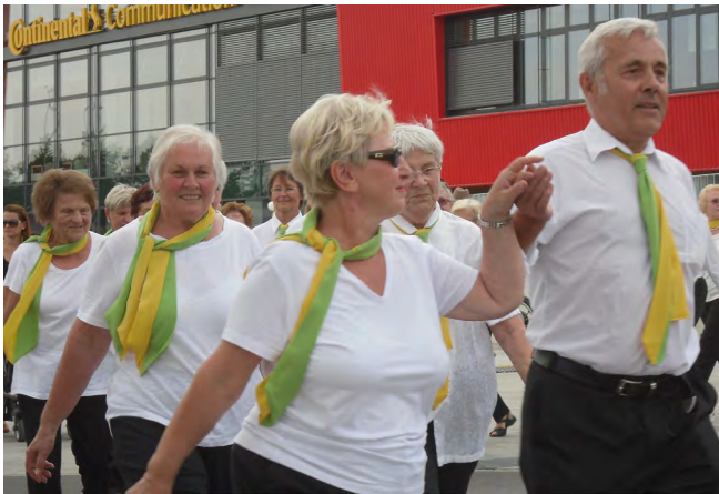
Einmarsch zur Präsentation unseres „Könnens“