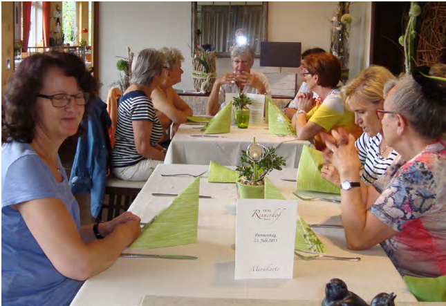
Im Reinerhof kann man vorzüglich Essen