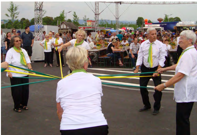
Einblick in die Ganzkörper Gymnastik mit Band

Aber dies tat der Freude über den gelungenen Auftritt keinen Abbruch. Fazit: Wir haben als Seniorenabteilung durch unsere Auftritte den Verein in der Öffentlichkeit hervorragend repräsentiert. Bevor wir in die „verdienten“ Sommerferien uns verabschiedeten, wollten wir