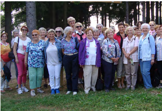
Hier waren wir

etwas „schwammrig“) mehr, fand der nächste die „Höhle der Illusionen“ spannender. Hier konnte man „live“ erleben, wie uns die Wahrnehmung etwas vorgaukelt und welche Konzentration erforderlich ist, den Täuschungen der Augen nicht zu trauen. Der