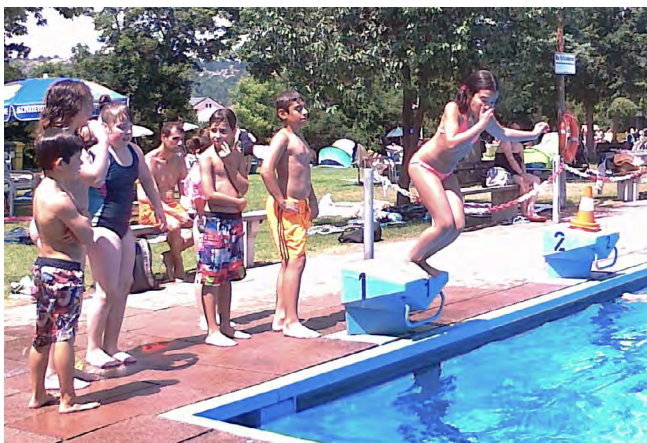
Ab ins kühle Nass

Am Ende des Schuljahres und wegen der großen Hitze waren weniger Kinder/Jugendliche beim Handballtraining. Wegen der Anzahl der Spieler wurden zwei Gruppen mit unterschiedlichen Trainingszeiten eingeführt.